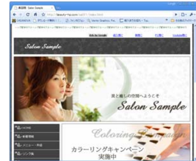
即座にコンテンツ画面に反映されます。