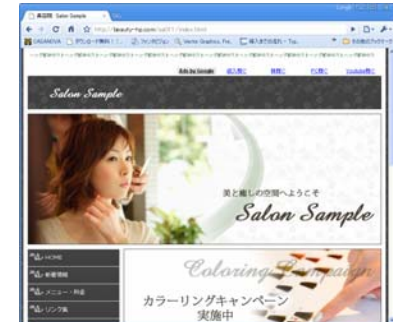
即座にコンテンツ画面に反映されます。