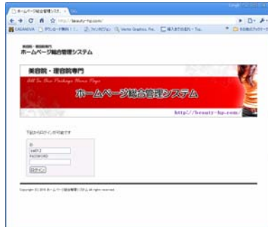
ID・PASSを入力し、ログインします。

いつでもインターネットさえ繋がるパソコンがあればどこでも更新できるので常に最新の内容を掲載することが出来ます。