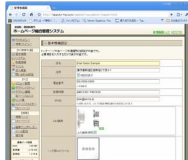
店舗情報などを入力して保存します。