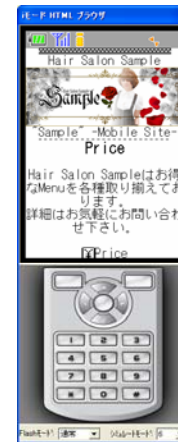
携帯版のサンプル画面 (一般公開画面)