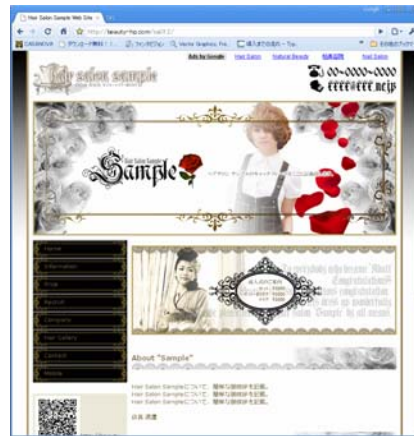
パソコン版のサンプル画面 (一般公開画面)