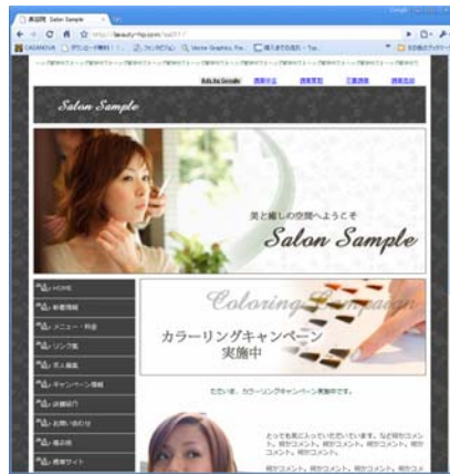
パソコン版のサンプル画面 (一般公開画面)

季節や気分によって 背景画像や写真なども好きな画像 を入れることができます。毎日の新着ニュースやイベント情報などを毎日更新できるので常に最新の内容を掲載することが出来ます。